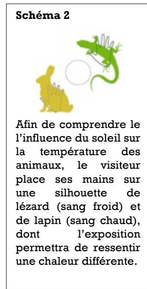
Exemple de manipulation proposée au visiteur (schéma 1) et comment s'inspirer du milieu naturel pour trouver les solutions (schéma 2)