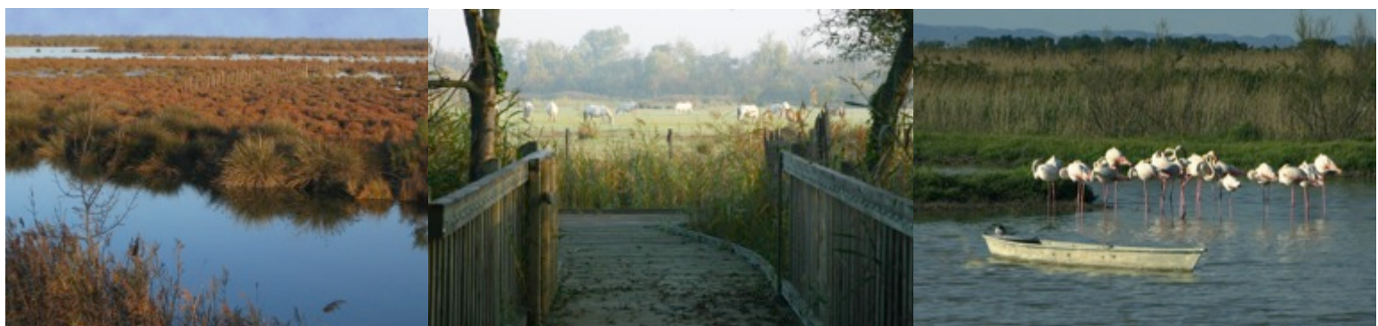
De gauche à droite: Vue du Marais du Vigueirat (sud), Vue du sentier de la Palunette (nord), Flamants roses dans une roselière (sud)

Ce projet a eu pour ambition de diminuer l'impact des activités humaines (dont la fréquentation du site) sur les Marais du Vigueirat, grâce notamment à diverses installations écologiques au niveau de l'eau, de l'énergie et des déchets dans le cadre d'un tourisme responsable. Il doit permettre de sensibiliser les différents publics autour des problématiques d'écoresponsabilité, c'est-à-dire de limitation des pollutions de tous ordres.